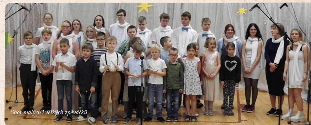
Sbor malých i velkých zpěváčků