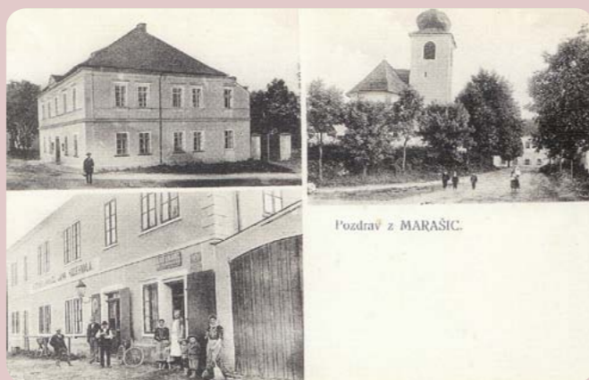
Nahoře: fotografie Morašic ze 40. let 20. století – pohled na ves od Lažan, stará budova obecné školy, kostel a Vodehnalův statek s hostincem.