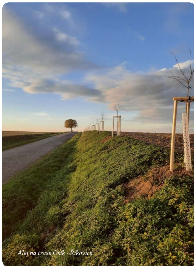
Alej na trase Osík - Říkovice