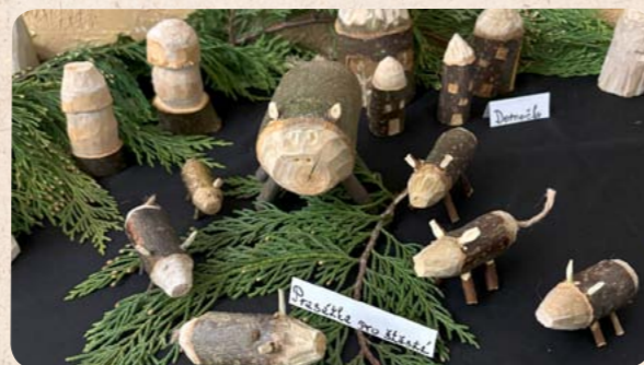
Vánoční výrobky řezbářského kroužku

Samotná škola se otevřela veřejnosti ve 14 hodin. Návštěvníci se mohli kochat krásnou vánoční výzdobou, poté navštívili kavárnu U Sněhové vločky, vyrobili si vánoční ozdobu, snažili se napsat, jaká je