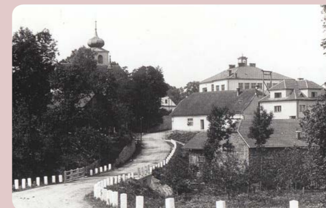
Pohled na Morašice ve směru od Lažan na snímku ze 40. let 20. století.