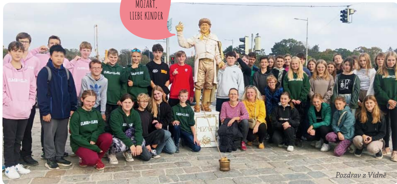
Pozdrav z Vídně