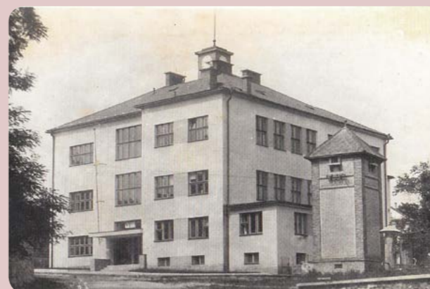
„Nová“ školní budova na snímku z období protektorátu (asi kolem roku 1941).