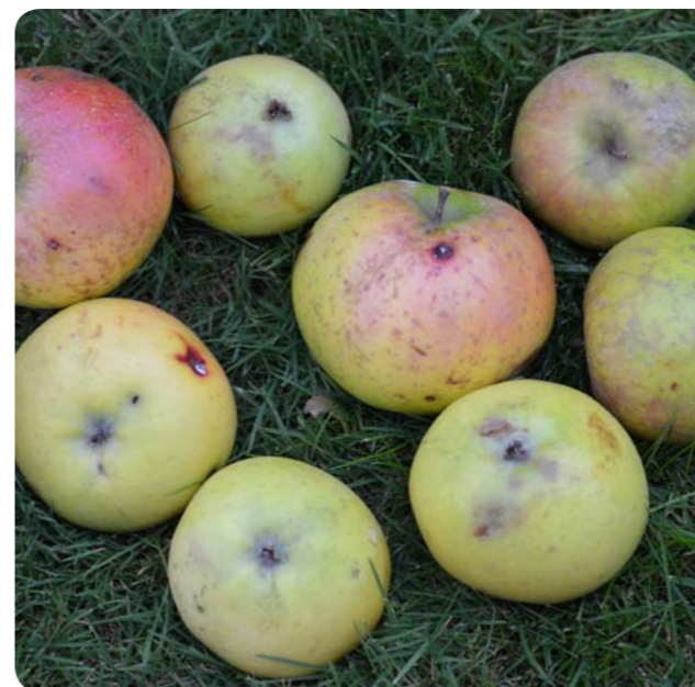
Typické plody nasbírané na konci října pod stromem.