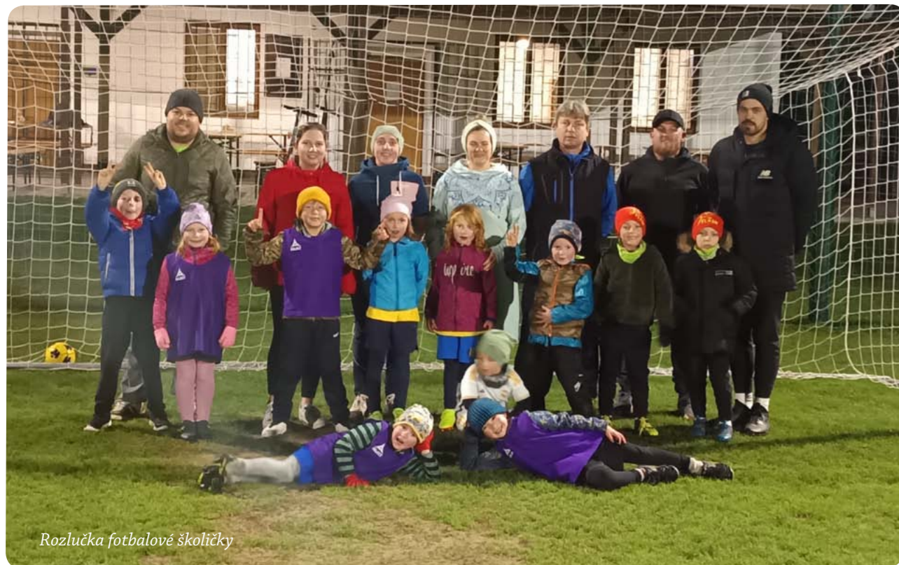
Rozlučka fotbalové školičky