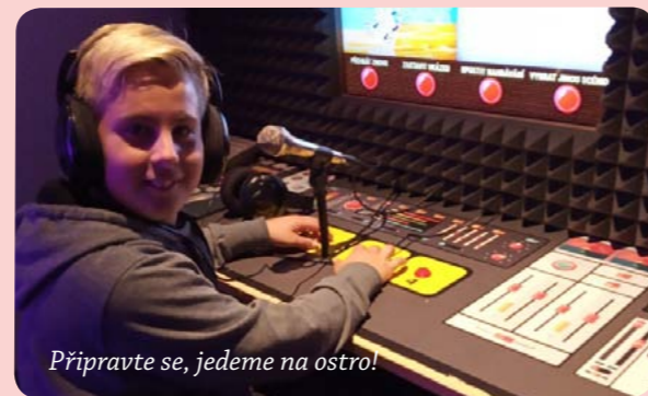
Připravte se, jedeme na ostro!