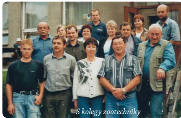
S kolegy zootechniky

Ano, protože jsem byl přesvědčen, že mě nikdo nezmění. Nikdy jsem ve straně nebyl. Moje děti chodily na náboženství, a to jsem měl pořád na talíři. Můj tatínek vstoupil do strany, jen proto, abychom mohli studovat. Byla to divná doba.