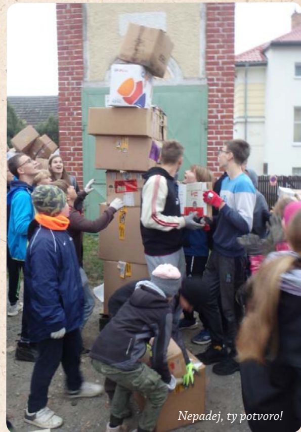
Nepadej, ty potvoro!