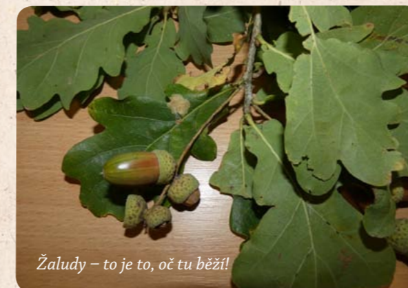
Žaludy – to je to, oč tu běží!