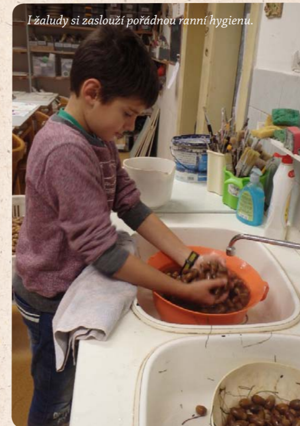
I žaludy si zaslouží pořádnou ranní hygienu.