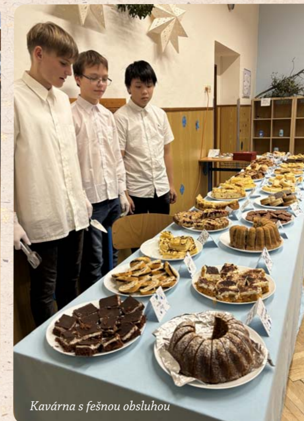
Kavárna s fešnou obsluhou

jejich představa o Ježíškově. Prohlédli si knihy a nějakou darovanou si vybrali a vhodili libovolnou částku do pokladničky. Zavzpomínali také na Vánoce, jak vypadaly před mnoha lety, udělali si památeční foto ve fotokoutku. Dále mohli rozjímat v knihovně a začíst se do knih s vánoční tematikou.