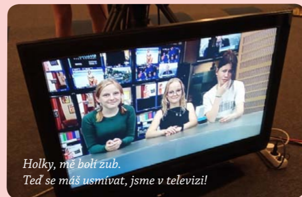
Holky, mě bolí zub. Teď se máš usmívat, jsme v televizi!