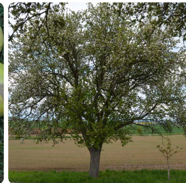
Vzrostlý starý strom v plném zdraví.