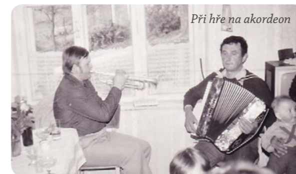
Při hře na akordeon

Ano. Hudbu miluji. Rád si poslechnu třeba Spiri- tuál kvintet, kapelu Schovanky, hudební skupinu Kučerovci nebo Rangers – Plavci. S mojí man- želkou máme stejný vkus. Moc rádi jsme chodili na koncerty. Vážnou hudbou nepohrdneme, rádi jsme chodili také na Smetanovu Litomyšl. Milo- vali jsme plesy, které jsme celé spolu protančili. Rád jsem měl waltz, tango, ale i klasický valčík.