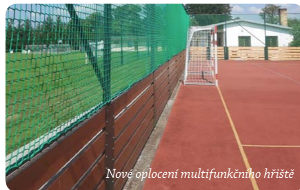
Nové oplocení multifunkčního hřiště

V průběhu července proběhla slíbená realizace opravy oplocení multifunkčního hřiště v Morašicích. Nevhovující a nebezpečné oplocení bylo vyměněno za jiné. Multifunkční hřiště využívá mateřská i základní škola pro své venkovní aktivity. Branka hřiště je otevřena ale i pro všechny občany, kteří chtějí využít „antukový“ povrch.