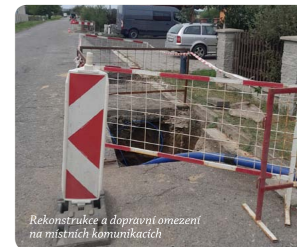
Rekonstrukce a dopravní omezení na místních komunikacích

Stále probíhá rekonstrukce vodovodního řadu. V zemi je už nové vedení vodovodu, ale stále probíhají dokončovací práce. Vše, včetně předání evidence a zaměření, by mělo být hotovo do konce letošního roku. Prosíme stále o trpělivost a toleranci. Děkujeme.