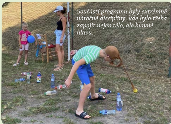
Součástí programu byly extrémně náročné disciplíny, kde bylo třeba zapojit nejen tělo, ale hlavně hlavu.