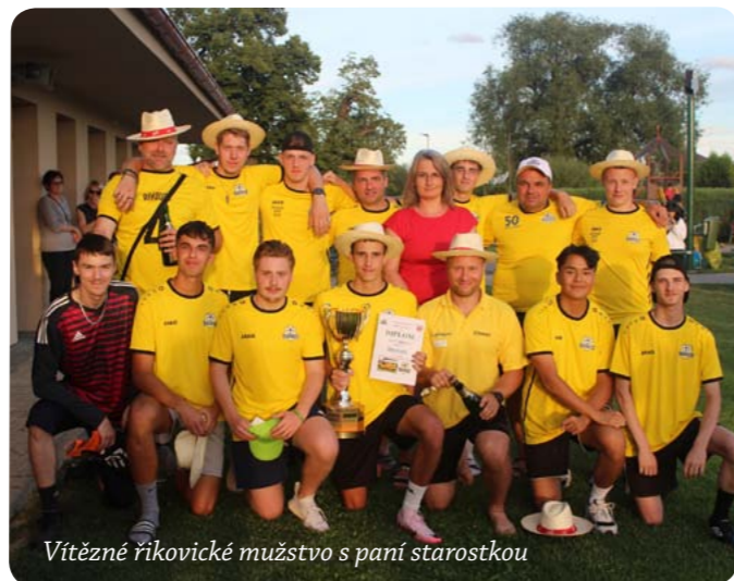
Vítězné říkovické mužstvo s paní starostkou