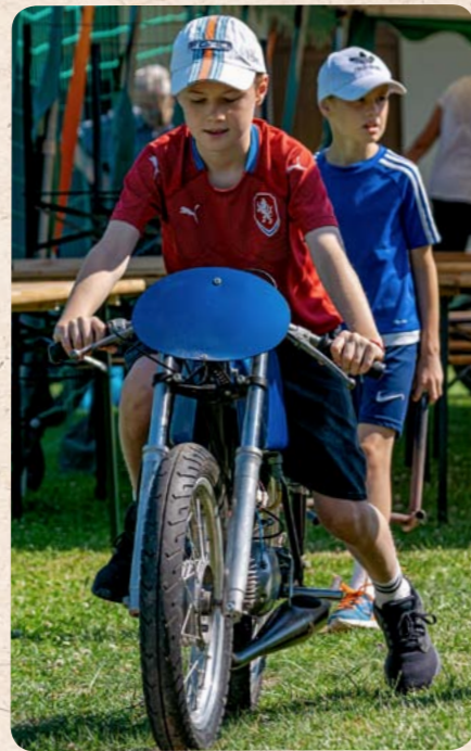
Jasný, to dám!

Letos se sice v Morašicích nezávodilo, ale zvuk některých závodních motocyklů si nakonec mohli účastníci milého setkání alespoň poslechnout.