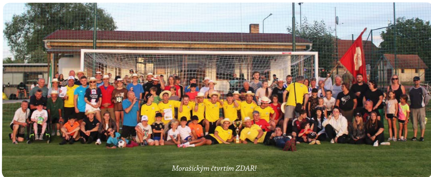
Morašickým čtvrtím ZDAR!