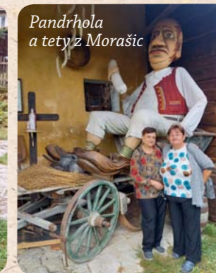
Pandrhola a tety z Morašic