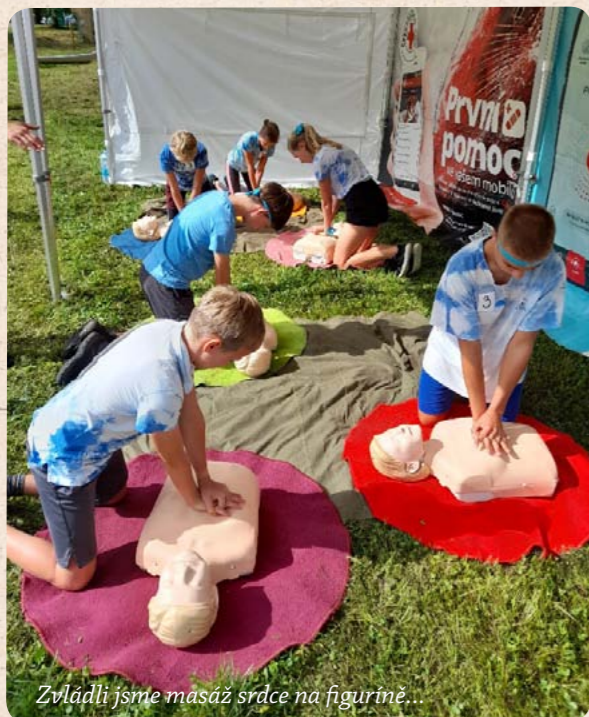
Zvládli jsme masáž srdce na figuríně...

Velkou zkušenost a současně i pochvalu za zvládnutí situace si děti odnesly ze stanoviště první pomoci, kde na ně čekaly velmi realisticky namaskované osoby a děti si musely poradit s masivním krvácením, poruchou vědomí nebo stavem šoku.