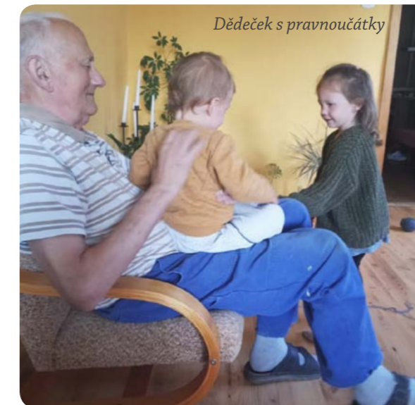
Dědeček s pravnoučátky

Radost mi neustále dělá moje rodina. Moje děti, vnoučata a pravnoučata. Vždy když přijdou, tak řeknou: „Ahoj dědečku“. Jsem vděčný za každou chvilku, kterou s nimi strávím.