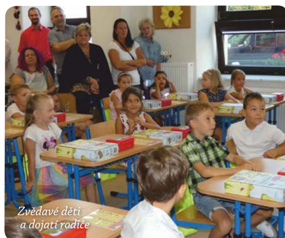
Zvědavé děti a dojatí rodiče

Přeji všem žákům, rodičům a zaměstnancům školy úspěšný a příjemný školní rok!