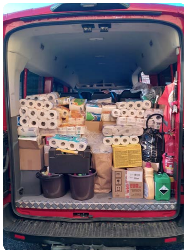
Naše hasičské auto naložené materiální pomocí