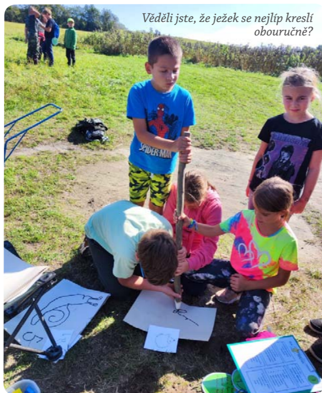
Věděli jste, že ježek se nejlíp kreslí obouručně?

Děkuji a těším se na další bádání, Stanislava Coufalová