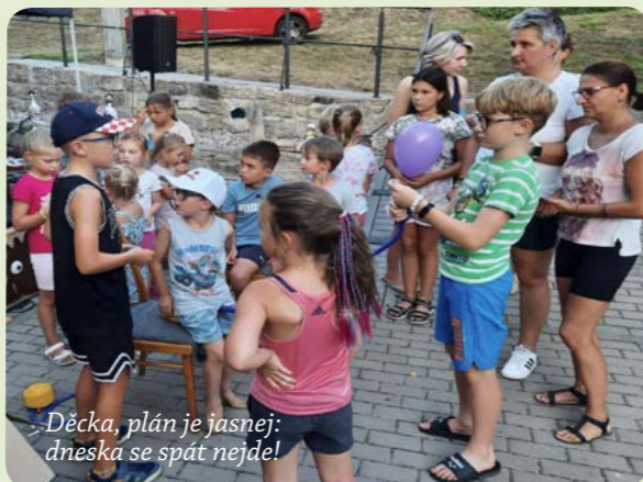
Děcka, plán je jasnej: dneska se spát nejde!

Krásné slunečné počasí nám dopřalo se s létem opravdu rozloučit. V sobotu 7. 9. jsme uspořádali Rozloučení s prázdninami. Soutěžní odpoledne plné různých úkolů čekalo nejen na děti, ale počítali jsme i s účastí dospělých. Úkoly byly vymyšleny tak, aby všichni soutěžící zapojili hlavu i tělo. Po splnění všech úkolů na děti čekala sladká odměna. Všichni ale netrpělivě čekali na slíbenou tombolu. Opravdu se jed-