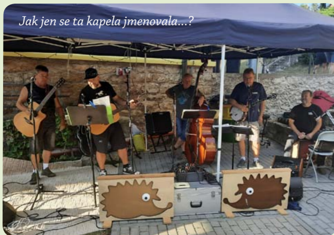
Jak jen se ta kapela jmenovala...?