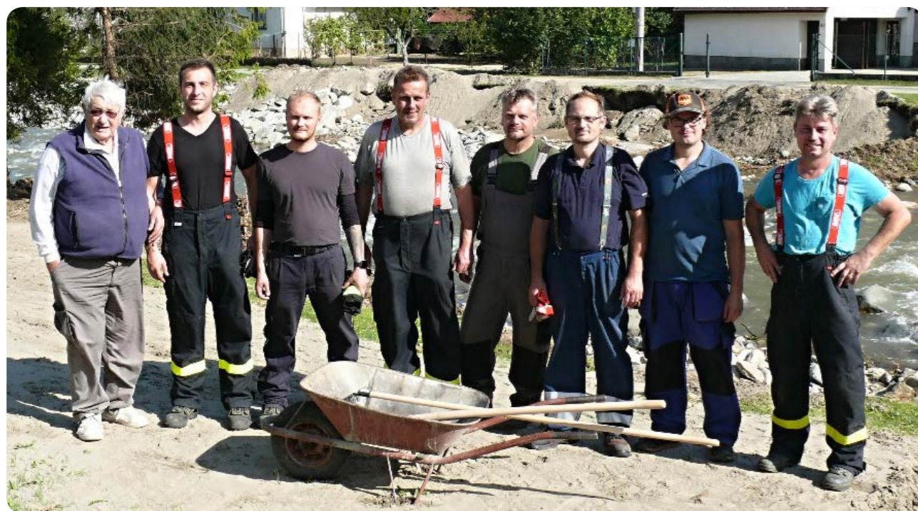
Parta morašických dobrovolníků v obci Kobylá nad Vidnavkou na Jesenicku, kterou postihly ničivé povodně.