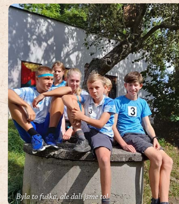
Byla to fuška, ale dali jsme to!