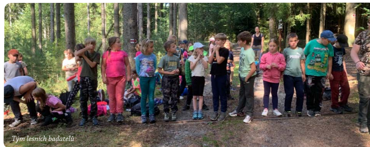
Tým lesních badatelů