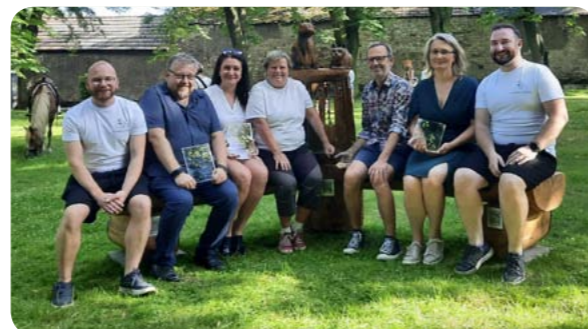
Naše paní starostka spolu s dalšími zástupci oceněných obcí

Jako vítězové v prvním kole jsme automaticky zařazeni i do kola druhého, ve kterém bojujeme o titul OBEC ROKU 2024. Hlasovat na Instagramu Dvou kocourů na cestách můžete až do 31. 12. 2024.