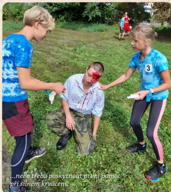
...nebo třeba poskytnout první pomoc při silném krvácení.

Nově letos byla připravena střelba na airsoftové střelnici, orientační běh formou labyrintu a překonání lanové dráhy nad řekou. Po součtu bodů ze všech soutěžních úkolů jsme se umístili na pěkném osmém místě. Všechny disciplíny i celý den si děti užily, především perfektní týmovou spoluprací a naučily se mnoho nového.