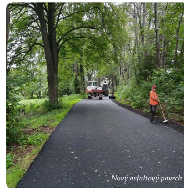
Nový asfaltový povrch

Pouze 14 dní předem jsme se dozvěděli, že je plánovaná oprava silnice III/3594 v úseku Řikovice - Višňáry. Silnice byla ve velmi špatném stavu, a tak si nový povrch opravdu zasloužila. Nejhorší byly zničené okraje silnice a záplaty velkých děr po celém úseku. Úplná uzavírka silnice probíhala od 15. 7. do 17. 7. Celá oprava byla dokončena 24. 7. Jsme velmi rádi, že k opravě celého úseku došlo, protože příjezd do Řikovic od Višňárů připomínal spíše tankodrom.