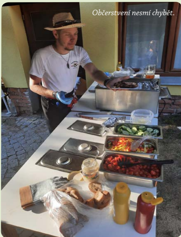
Občerstvení nesmí chybět.

nalo o bohatou tombolu, ve které se vyhrávaly jen samé užitečné věci. Sobotní podvečer nám zpříjemnila kapela Ježkovy voči, která hrála až do půl jedné do rána. Dospělí tancovali, děti si společně hrály na hřišti. Zkrátka povedená akce. Bylo to super. Společenskou akci obohacenou o hudební doprovod naplánujeme určitě i na příští rok.