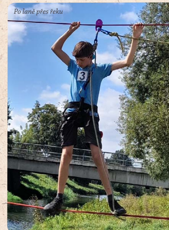
Po laně přes řeku