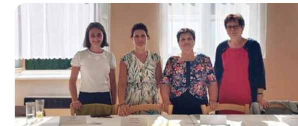
Usměvavé volební komise čekaly na voliče v obou okrscích.