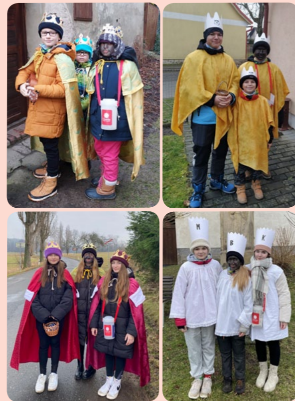
Královské party v plné parádě

Děkujeme všem lidem, kteří tradiční tříkrálovou akci podpořili a svým dobrým skutkem přispěli na lidi v nouzi. Děkujeme zároveň i všem tříkrálovým dobrovolníkům, kteří svůj volný čas věnovali smysluplné aktivitě.