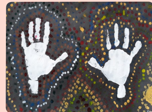
Naše šikovné ruce rády tvoří.

Jako každé jaro se chystáme na Velikonoce, oslavu svátek všech maminek, chodíme na delší vycházky, pozorujeme přírodu a učíme se ji ochraňovat. V březnu na fotbalovém hřišti uvidíme společně s dětmi ZŠ letové ukázky s opravdovými dravými ptáky. Jen aby se tam nepřiletěl podívat i náš Fanda Kosák. Létat umí sice rychle, protože když jedeme plavat, tak je v Litomyšli vždycky dřív než my. Dravcům by ale neuletěl, a to by špatně dopadlo. Na naší zahradě je vůbec spousta ptáčků, vrabčáků, sýkorek, kosáků, zvonků. Ted' na jaře nám od rána krásně zpívají, protože jsme je v zimě krmili slunečnicí.