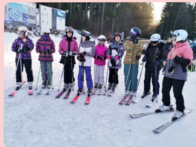
Lyžařská skupina nastoupena k výcviku.

Pondělí začínalo v 6.30 budíčkem, snídani jsme stanovili na 7.00 a v 7.30 jsme museli všichni být připraveni v lyžařském a s kompletní lyžařskou výzbrojí před chatou. Sešli jsme dolů na parkoviště a čekali na příjezd ski busu. Ten byl většinou už z části obsazen, tak jsme se do něho natlačili a jeli jsme na sjezdovku. Zde jsme vytvořili družstva a začalo dopolední lyžování. První až třetí skupina už jely na sjezdovky (střídalý modrou, červenou, a nakonec i černou), kde se rozcvičily, a začal samotný lyžařský výcvik. Čtvrtá skupina se přesunula do Kids-parku, kde začala též samotná výuka. V 11.40 jsme odjžděli