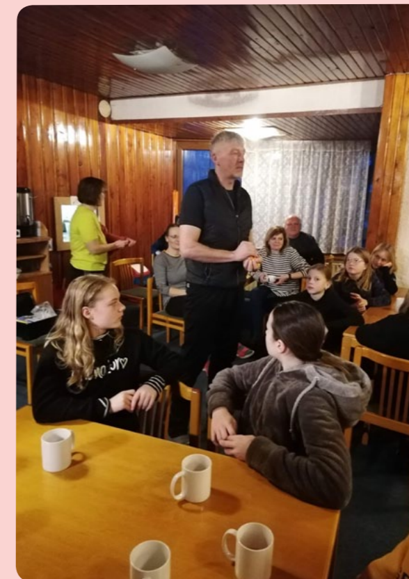
Beseda po večeri