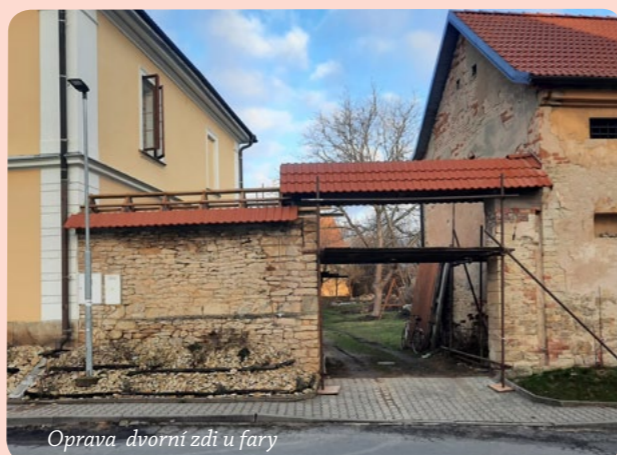
Oprava dvorní zdi u fary