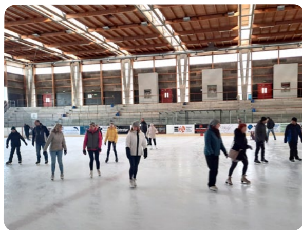
Užili jsme si led volný jen pro nás.

V hojném počtu jsme se v neděli 25. 2. setkali na zimním stadionu. V jedné třetině ledové plochy hráli chlápci a muži hokej a na zbylém prostoru se volně bruslilo. Je pravdou, že i některé dívky se nebály a hokej si s chlápci šly také zahrát. Byli mezi námi i ti nejmladší, kteří bruslit ještě neumí, ale měli prostor si pohyb na bruslích v klidu vyzkoušet. Hodinka a půl bruslení na stadionu byla na sklonku zimní sezóny úplně ideální. Jsme rádi, že jsme nedělní odpoledne mohli strávit společně sportem. Zároveň jsme se mohli setkat se svými spoluobčany a popovídat si.