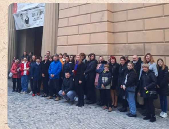
Společné foto před divadlem Hybernia

Z rušné Prahy jsme se plni zážitků vrátili do našich poklidných obcí. Déšť nás pozdravil těsně před odjezdem domů. Průjezdem Prahou jsme už ze sedaček autobusu pozorovali nádhernou dvojitou duhu. Jsme moc rádi, že jsme společně mohli strávit sobotní den. Těšíme se opět na další společný výlet za kulturou.