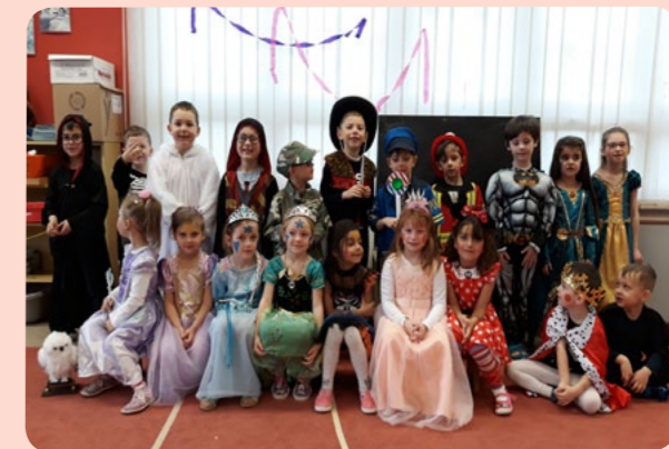
Kouzelná karnevalová školka