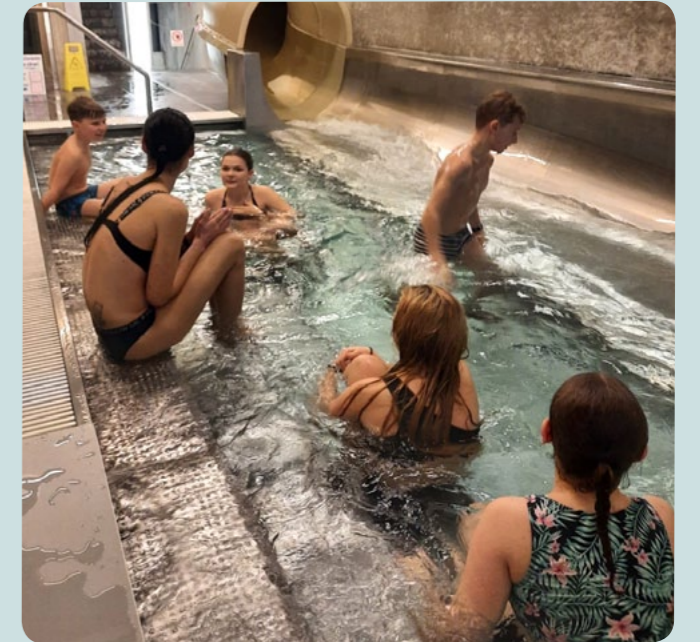
Nejdřív tobogán, pak vířivku. A pak zase tobogán...

Po dvou letech obec opět zarezervovala navečer 9. 2. a 1. 3. Městský bazén Litomyšl, a to jen a pouze pro naše občany. To znamenalo, že veškeré prostory bazénu zaplnili pouze naši občané. A tak tobogán byl celé dvě hodiny v obležení téměř všech našich dětí. Nemůžeme zapomenout ani na dospělé, kteří svojí jízdou na tobogánu probudili své „mladší já“. Také vířivka byla celé dvě hodiny stále plná. Kdyby v Litomyšli měli vířivku dvě, určitě bychom je zaplnili. Odvážnější se otužili ve venkovním bazénku a někteří pro relax zvolili páru. Velký prostor nabízel i plavecký bazén, ve kterém se v klidu dalo zaplavat nebo i skočit šipku do vody. Někteří si užívali masáž pod proudem tryskající vody v teplejším dětském bazénu, a to nejen naši nejmenší, pro které je tento menší bazén určen. Po uplynutí dvouhodinové rezervace se především děti těšily do bufetu, ve kterém si mohly koupit nějakou tu sladkost nebo párek v rohlíku, aby doplnily vydanou energii ve vodě.