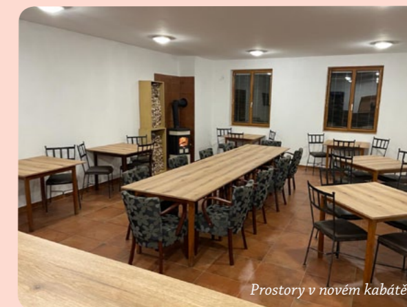
Prostory v novém kabátě