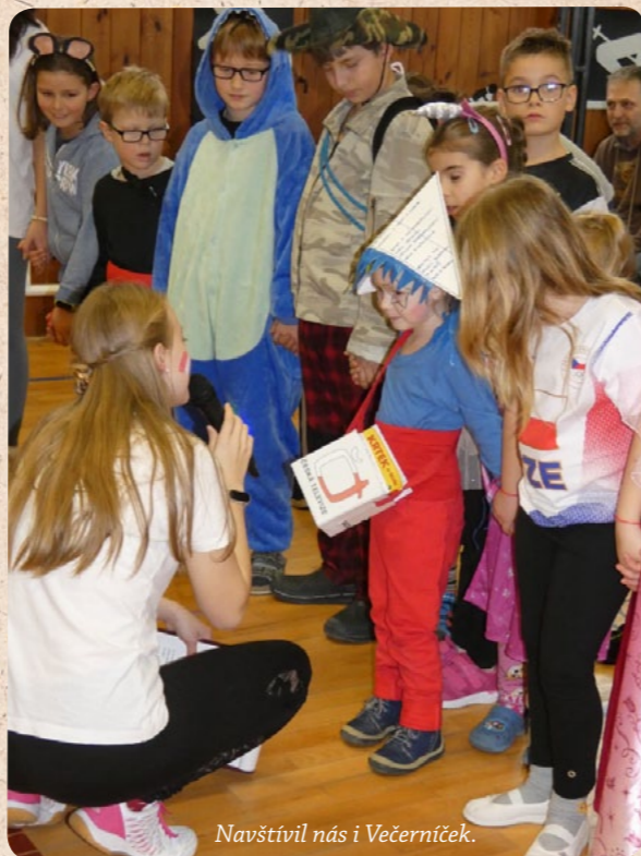
Navštívil nás i Večerníček.