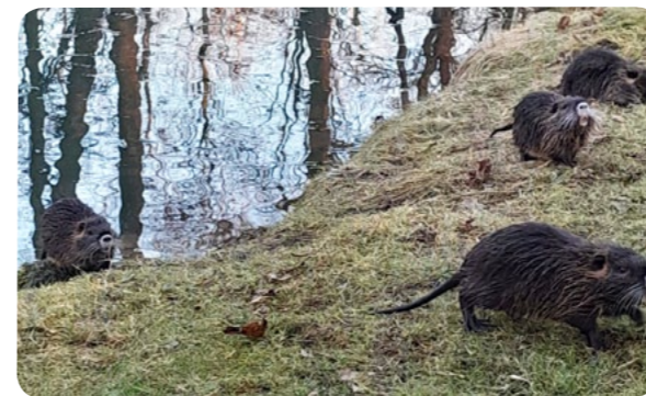
Nutrie v Lažanech

Jejich rozmnožování je velmi progresivní s následnými negativními dopady na přírodu. Stejný problém řeší již v Litomyšli. Nutrie se totiž výrazně rozmnožily i na březích řeky Loučny.