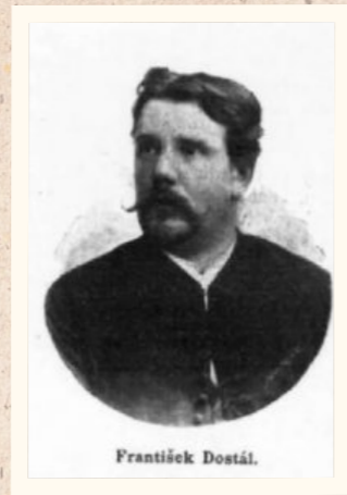
František Dostál (1855–1921)

V 90. letech 19. století se zapojil i do zemské politiky. Ve volbách v roce 1895 byl zvolen v kurii venkovských obcí (volební obvod Jičín, Sobotka, Lomnice, Libáň) do Českého zemského sněmu. Politicky patřil k mladočeské straně.