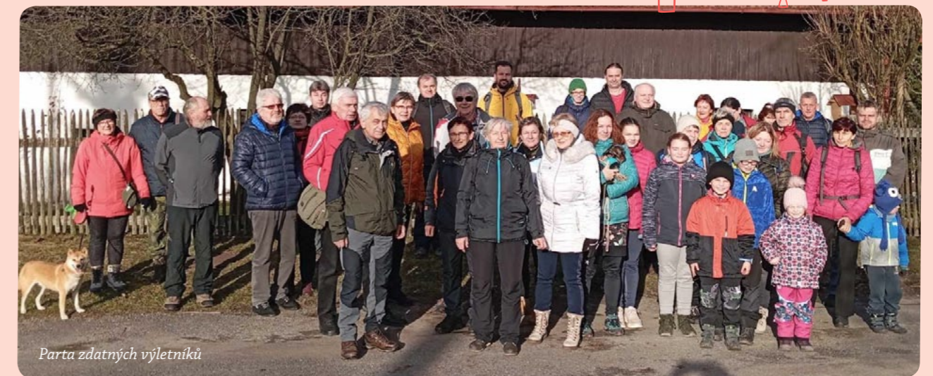
Parta zdatných vyletníků

Ve středu 27. 12. 2023 se vydalo 43 morašických občanů, jejich rodinných příslušníků a přátel a 2 psi na pěší výlet do Toulcových Maštálí. Pro zajímavost nejstarším účastníkem bylo 74 let, nejmladšímu 1 rok, protože ještě ale nechodil, tak se celou cestu nesl. Počasí nám přálo a až na místy blátivé lesní cesty se nám dobře šlapalo. Nakonec jsme si všichni pobesedovali v jarošovské hospodě, kde nám místní hasiči připravili občerstvení.