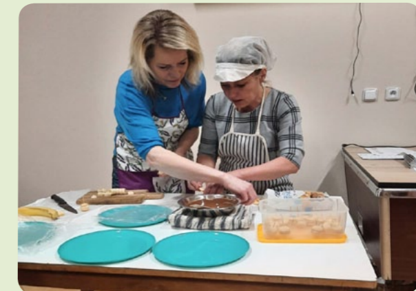
Všichni bedlivě sledovali práci dvou zdatných cukrářek.