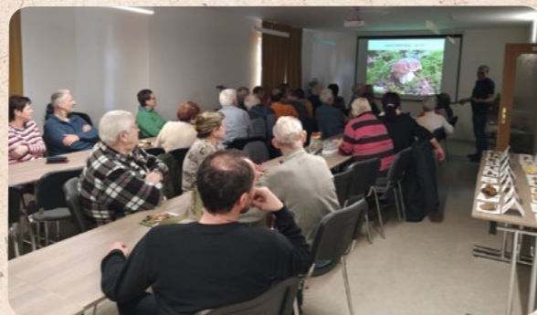
Promítání i výstava skutečných exemplářů