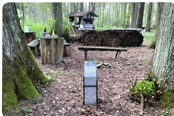
Zahájení myslivecké sezóny v Doubravě Psiček mývalovitý