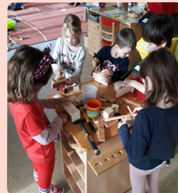
Zatloukáme, vyrábíme, kutíme - to nás baví!

Ve čtvrtek 22. 2. byla školka plná princezen, zvířátek, hasičů, policistů i dalších masek. Byl karneval. Přišel i kouzelník až z Ostravy, ale nevykouzlil králíka z klobouku, „jen“ za pomoci dětí čaroval s kartami a provázky.